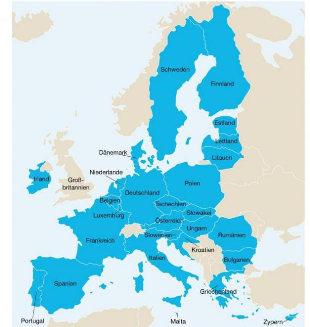
Mitglieder der Europäischen Union

Karte der EU-Mitglieder: Staaten, die Mitglieder der EU sind, sind auf der Karte blau dargestellt.