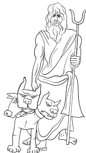
Die griechischen Götter Zeus, Hera und Hades