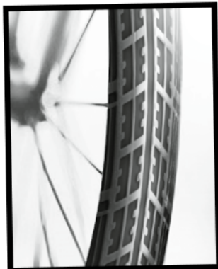
Reifenprofil Nr. 2