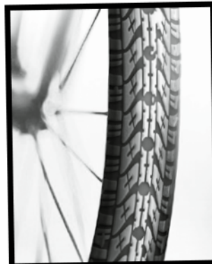
Reifenprofil Nr. 3