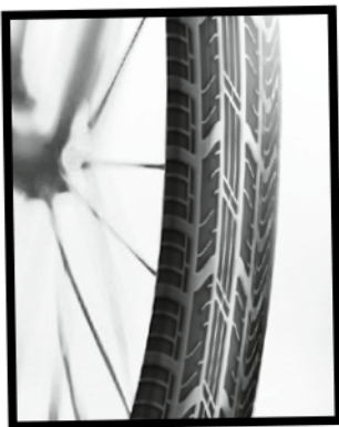
Reifenprofil Nr. 1