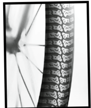
Reifenprofil Nr. 4

❖ Lösung: Das Reifenprofil des Reifens mit der Nummer _____ stimmt mit dem Abdruck auf Karls Foto überein, weil