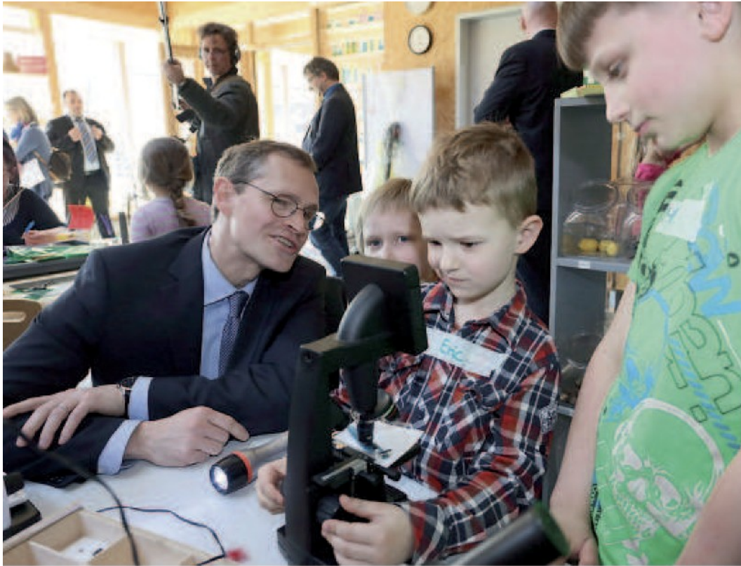
M1 Der Regierende Bürgermeister von Berlin, Michael Müller, im Kinderforschungszentrum Marzahn-Hellersdorf, März 2015