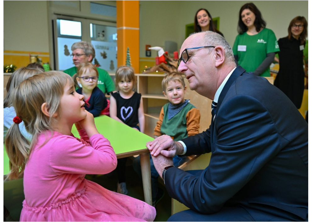
Der Ministerpräsident von Brandenburg, Dietmar Woidke (SPD), in der Kita „Abenteuerland“.