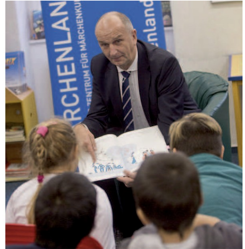
M2 Der Ministerpräsident von Brandenburg, Dr. Dietmar Woidke, liest Schülern in ihrer Klasse etwas vor, November 2015