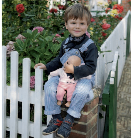
M2 Ein kleiner Junge spielt mit seiner Puppe

2a Im Laufe seines Lebens nimmt der Mensch verschiedene Rollen an, an die unterschiedliche Erwartungen geknüpft sind. Solche Rollen sind z.B. die des Kindes, des Schülers, des Arbeitnehmers oder die Rolle der Eltern.