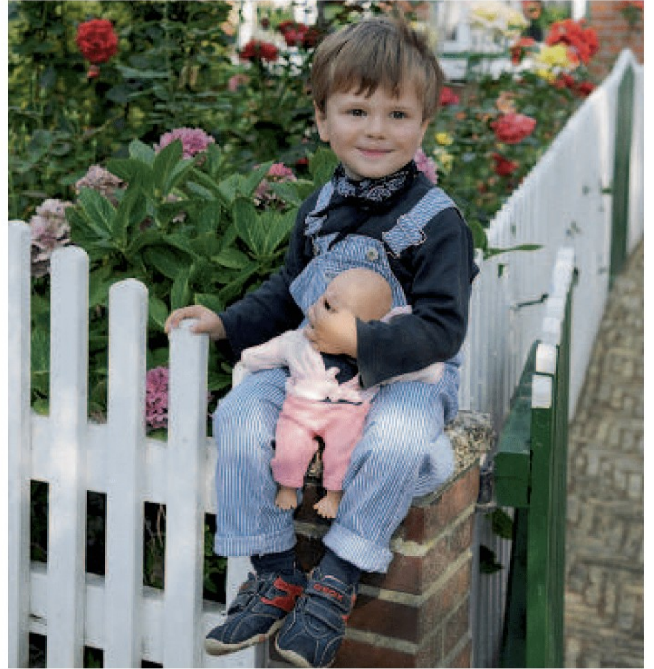
M2 Ein kleiner Junge spielt mit seiner Puppe