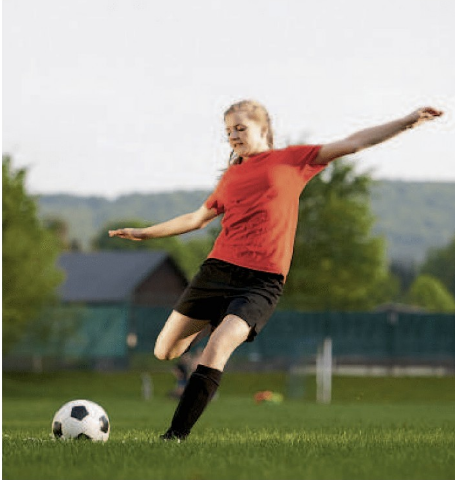
M1 Mädchen beim Fußballspielen